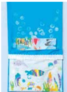
BATISTA "guarda libros infantil"