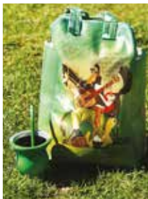
CUERO NATURAL "kit matero"