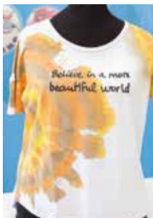
JERSEY "teñido batik"