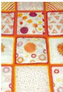
MATELASSE PIQUE "acolchado"