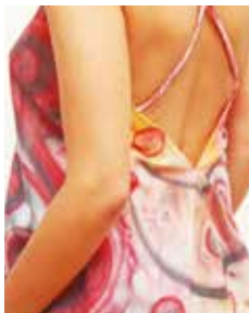
GASA MUSELINA "blusa"