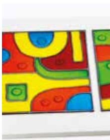
CD "Abstracción geométrica"