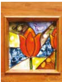
VIDRIO "Respaldos de cama"